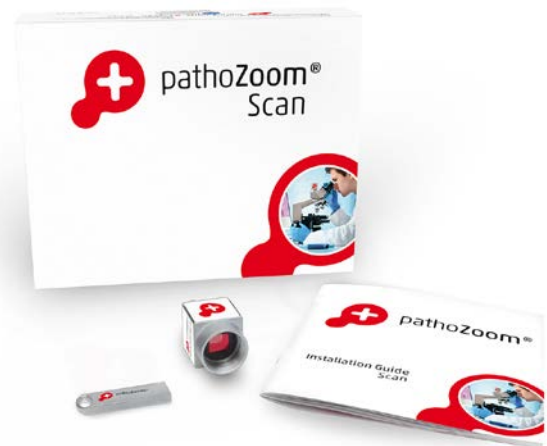
PathoZoom® Scan package: easy installation in a few minutes

두 시스템의 핵심 요소는 디지털 카메라이며 이를 통해 고해상도 이미지를 매우 빠르고 쉽게 캡처하고 인터넷으로 공유할 수 있습니다. 적합한 카메라를 고를 때 필수 고려 사항은 높은 색 충실도와 뛰어난 이미지 품질이었습니다. Smart In Media가 Basler MED ace 2.3 MP 41 color를 선택한 또 다른 이유는 "신뢰도가 높은 ISO 13485:2016를 준수한 제품으로 SDK가 매우 훌륭하며 가격 대비 성능이 뛰어나기 때문입니다." 특히 소프트웨어 개발 과정에서 두드러진 안정적인 기술 지원도 Smart In Media에게 확신을 심어주었습니다. 이 외에도 영업팀의 훌륭한 조언과 독일이라는 지리적 이점도 제품 선택에 기여했습니다.