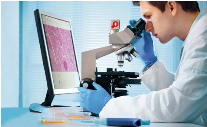
PathoZoom® Scan & SlideCloud