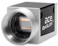
Basler ace 에어리어 스캔 카메라 - acA2440-20gm

https://www.youtube.com/watch?v=QHTORlb_BUO (설치 상태를 보여주는 Cind사 고객들 중 한 회사의 링크)