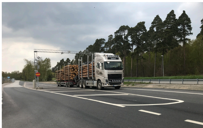
불륨 트럭 로드 측정

통나무 측정에는 Cind의 제품인 Timspect가 사용됩니다. 이 제품은 트럭 1대분에 해당하는 양을 1분 안에 자동으로 측정합니다. Cind의 솔루션은 카메라 기반 머신 비전 시스템이기 때문에 작업에 적합한 카메라를 선택하는 것이 매우 중요했습니다.