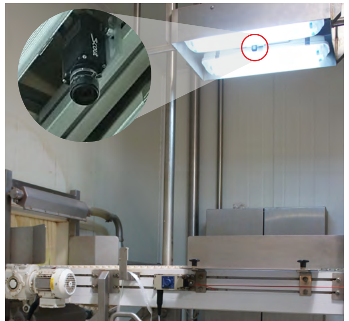
Basler scout GigE 카메라는 컨베이어 위의 광원 아래 설치되어 분말 자루의 그림을 캡처합니다.

카메라의 GigE 인터페이스는 VisionServer 프레임워크에 모든 이미지 데이터를 전송합니다. 소프트웨어는 이미지를 분석하여 시스템의 레시피 데이터베이스와 비교합니다. 틀린 재료가 추가되거나 필요한 수량과 다른 개수의 재료 자루가 컨베이어에 실리면 시스템이 알람과 경고 표시를 나타내 작업자가 오류 원인을 신속히 파악해 적절히 대처할 수 있게 합니다.