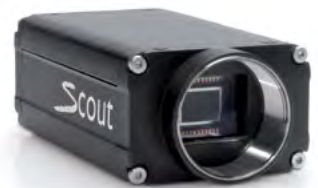
Basler scout scA1390-17gm GiG VISION

면책 조항 및 개인정보 보호 정책에 대한 내용은 www.baslerweb.com/disclaimer 를 참조하십시오.