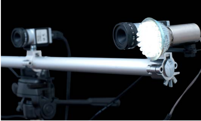
Basler ace 카메라 3대 중 2대가 배우의 연기를 녹화하고 있음