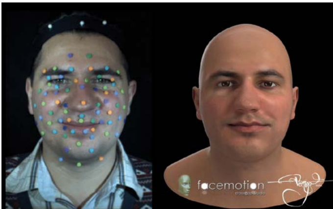
배우의 연기는 3D 애니메이션 캐릭터로 변환됩니다.

애니메이션 영화 산업은 규모가 커지고 빠르게 발전하고 있습니다. 실감나는 얼굴 애니메이션은 CG 애니메이션의 한 분야로서 지난 2년 동안 상당한 발전을 거듭해 훨씬 좋아지고 자연스러워졌습니다.